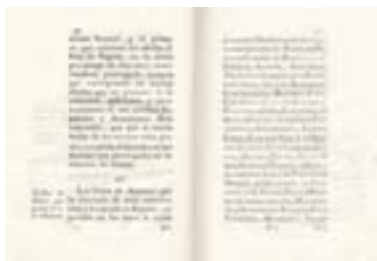
Reglamento y Aranceles Reales para el Comercio Libre de España a Indias, 1778, Madrid.