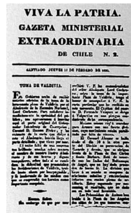
Edición extraordinaria de la Gaceta Ministerial con ocasión de la Toma de Valdivia, 1820

... se embarcaron las tropas con la mira de tomar posesión del cuartel enemigo en la batería del Pájaro, pero apareciéndose la O'Higgins enfrente del Morro de Gonzalo, abandonó la guarnición sus obras, huyendo precipitadamente; desembarcó la tropa en Niebla, hasta que la marea permitiese a los botes transportarla a Valdivia. De este modo están ya dirigadas contra los enemigos de la libertad y la independencia, las mismas 100 bocas de fuego de sus castillos, fuertes y baterías.