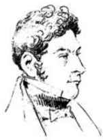
Jorge Beauchef Manuscrito (Bogotá), litogr. col. pape.

Habiendo desembarcado con poca oposición en la punta suroeste de la bahía de Valdivia, marché inmediatamente junto con el destacamento de infantería que mandaba el mayor Beauchef, a atacar al enemigo por aquella parte; él se consideraba perfectamente seguro de todo ataque aquella noche, en sus formidables fortificaciones.