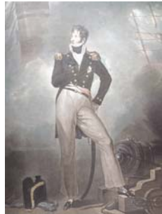
Lord Cochrane, 1807 P.H. Storching, óleo, Londres, col. part.

(Carta de Lord Cochrane al Ministro de Guerra y Marina José Ignacio Zamora, 5 de febrero de 1820).